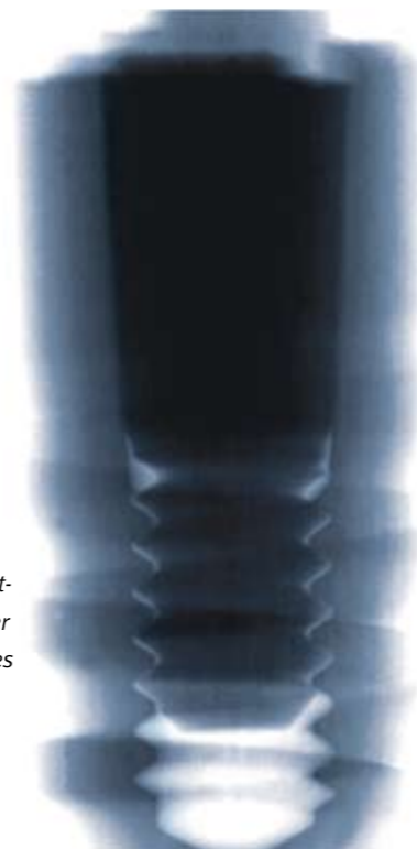
X-ray image of the Ankylos implant-abutment connection after 1,000,000 load cycles