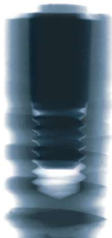
X-ray image of the Ankylos implant-abutment connection before start of the test